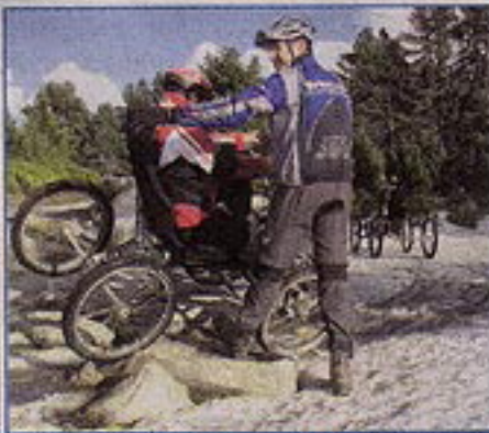
Le quad VTT est accessible à tous, été comme hiver, et vous procure des sensations bien sympathiques.

ce, comme sur les sols secs, le quad VTT présente l'avantage d'être utilisable en montagne été comme hiver.